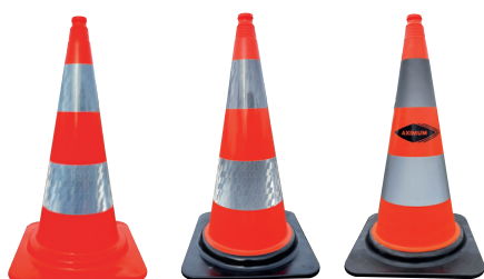
Modèle 75 cm avec film prismatique