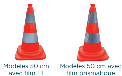
Modèles 50 cm avec film HI