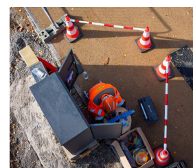
Barres extensibles de liaison