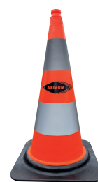
Exemple de sérigraphie