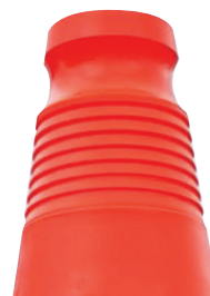
Tête avec stries et gorge

*Le PVC régénéré est issu des cônes usagés. Les cônes usagés sont soumis à un traitement de recyclage permettant de réutiliser la matière pour la conception de nouveaux cônes.