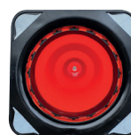
Option film rétro sous le cône

*** Autres couleurs sur demande : jaune/noire