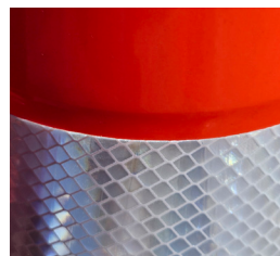
Bande rétro réfléchissante et système anti frottement