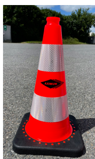
Exemple de sérigraphie

*** Autres couleurs sur demande : jaune/noire