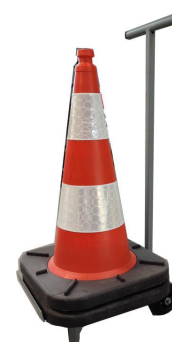
Chariot à roulettes